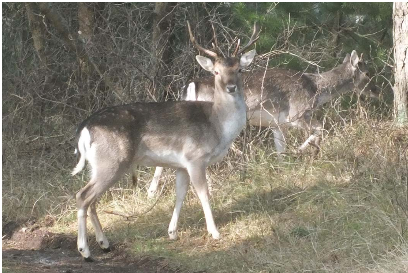
Dådyr i sommerhusområdet ved Øster Oksby, Blåvand