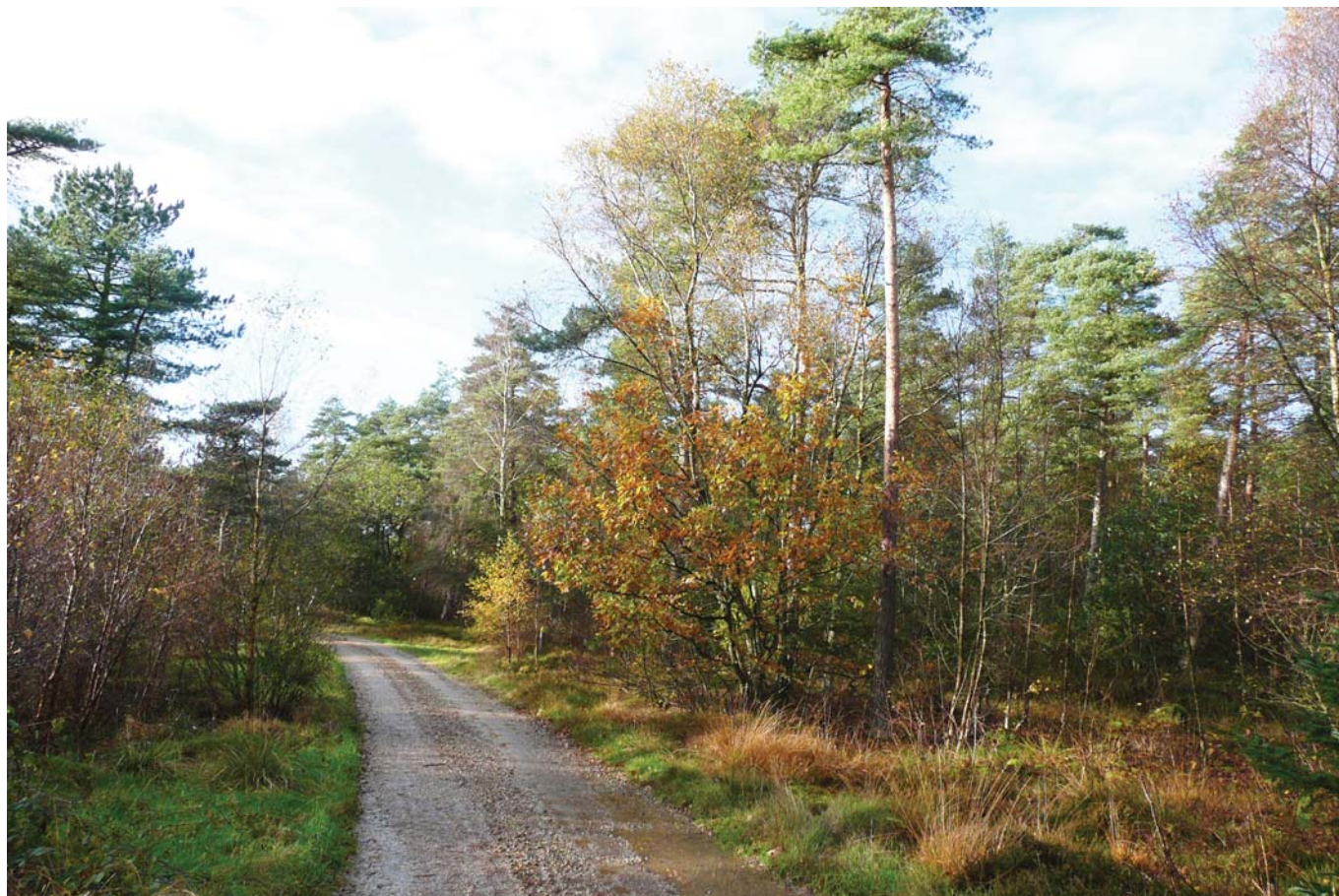
Bordrup Klitplantage efter en kortvarig efterårsbyge