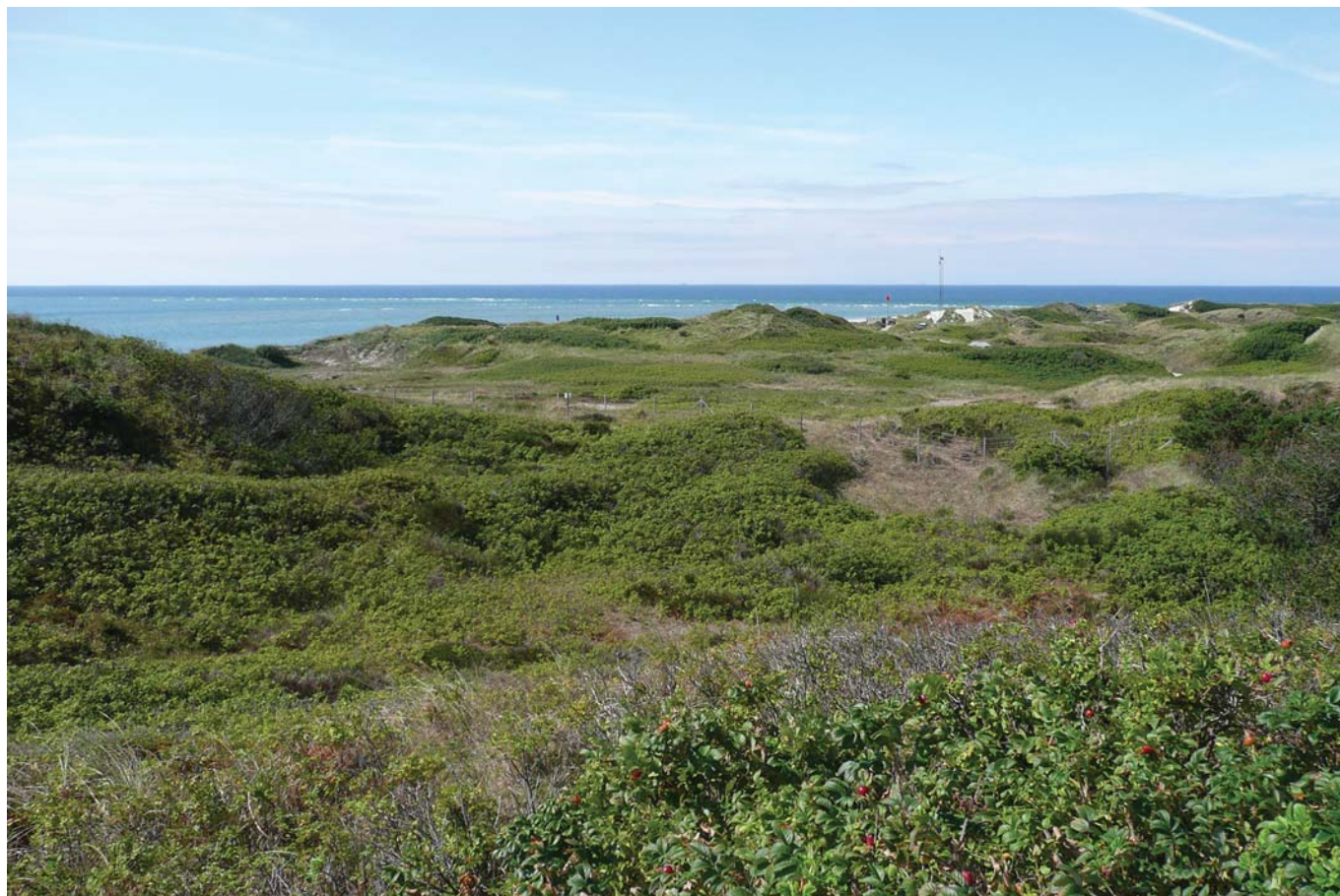
Klitterne ved Blåvand Fyr